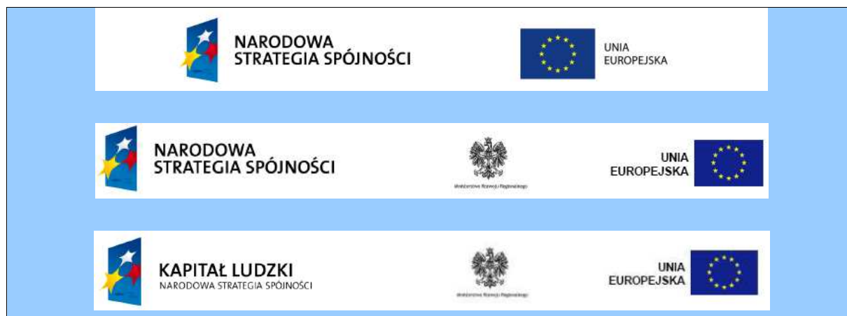
Tabela 7: Minimalny wariant oznaczania materiałów informacyjnych, promocyjnych i szkoleniowych

Szczegółowe zasady stosowania systemu wizualnego zostały określone w Księdze identyfikacji wizualnej Narodowej Strategii Spójności (załącznik nr 1 do Strategii) i obowiązują wszystkie instytucje oraz podmioty zaangażowane w proces informowania i promocji. Księga znaku zostanie przekazana do stosowania wszystkim instytucjom zarządzającym oraz zamieszczona na stronie internetowej www.funduszeuropejskie.gov.pl prowadzonej przez IK NSRO. Za rozpowszechnianie Księgi wśród instytucji pośredniczących i pośredniczących drugiego stopnia odpowiadają właściwe instytucje zarządzające. Przekazaniu Księgi towarzyszy komunikacja wyjaśniająca potrzebę i korzyści płynące z realizacji działań spójnych, identyfikowanych i realizowanych zgodnie z jej zawartością.