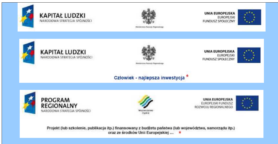
Tabela 6: Podstawowy wariant oznaczania materiałów informacyjnych, promocyjnych i szkoleniowych